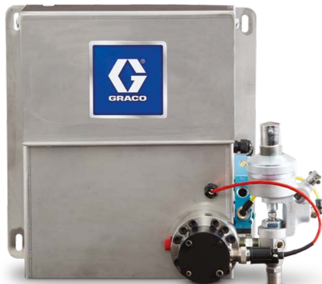
Панель оператора G3000 для подачи консистентной смазки

Вне зависимости от того, с каким количеством жидкостей вы работаете (их может быть от одной до восьми), система ProDispense позволяет полностью контролировать распределение каждой из них.