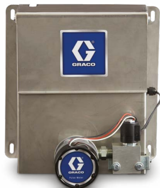
Панель оператора для подачи масла или воды