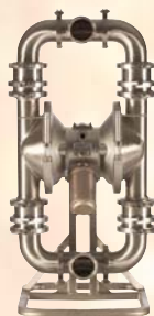
SaniForce 3150 HS 76 mm (3 in)