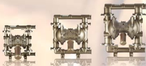
SaniForce 1040 38 mm (1,5 in)