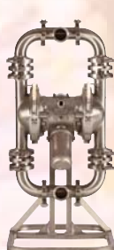
SaniForce 1590 HS 50,8 mm (2 in)