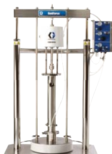
SaniForce 5:1 Scaricatore di fusti