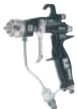
AAシリーズ エアアシステッドガン