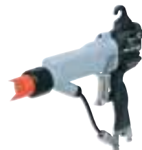
PRO Xs エアアシステッド静電ガン