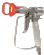
XTR エアレススプレーガン