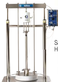
SaniForce 6:1 Hordóürítő