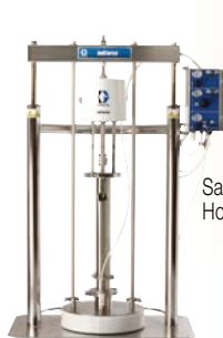
SaniForce 6:1 Hordóürítő