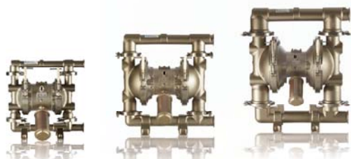
SaniForce 1040 38 mm (1,5 hüvelyk)