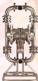
SaniForce 1590 HS 50,8 mm (2 in)

SF3AF1 Saniforce 3150 HS: clapeta de retención de 76 mm (3 in) con diafragmas sobremoldeados de EPDM