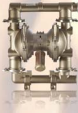
SaniForce 2150 63,5 mm (2,5 in)