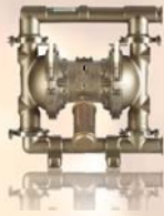
SaniForce 1590 50,8 mm (2 in)