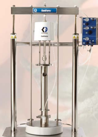
SaniForce 5:1 Urządzenie do rozładowywania zbiorników

24D940 Pompa membranowa z membraną i zaworami kulowymi wykonanymi z Santoprenu