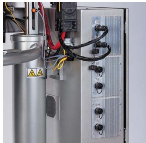
В установке присутствуют шесть точек подключения для двенадцати зон нагрева, определенных заказчиком

Компания Graco предлагает полную линейку систем подачи и нанесения Therm-O-Flow - каждая из которых может быть сконфигурирована с учетом Ваших требований.