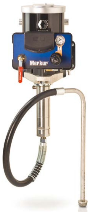
Falra szerelhető airless csomag

*Minden csomag tartalmaz egy 7,5m (25 láb) hosszú festék tömlőt