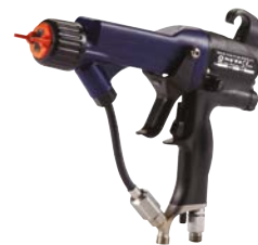
PRO Xp™ Levegőrásegítéssel elektrosztatikus rendszer