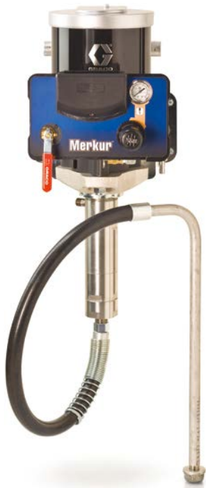
Falra szerelhető airless csomag