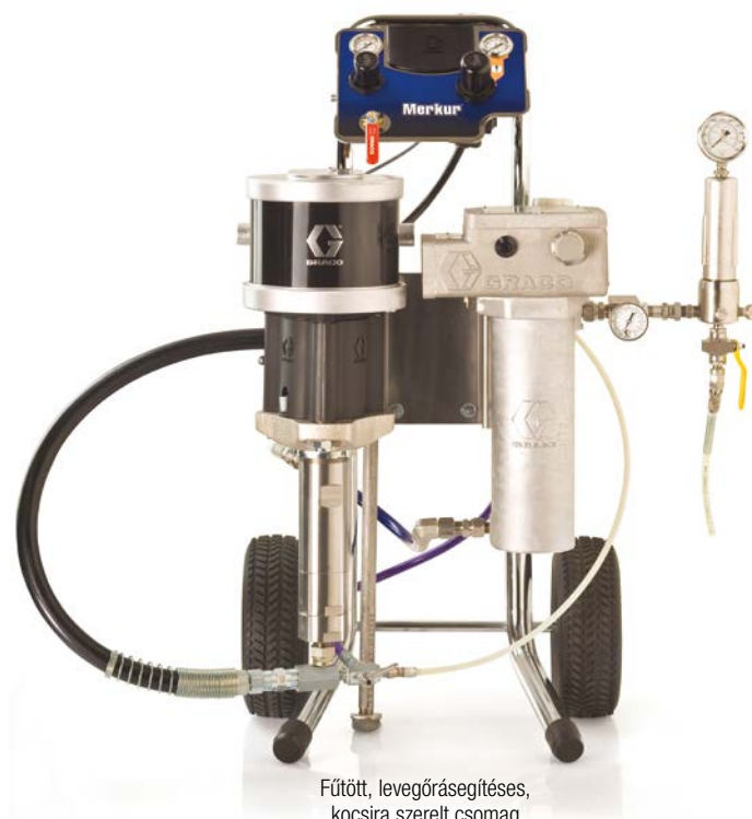
Fűtött, levegőrásegítéssel, kocsira szerelt csomag

*Minden csomagban egy darab 7,5 m (25 láb) hosszúságú folyadék- és levegőtömlő található