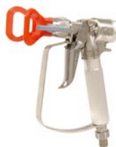
XTR™ Airless pisztoly