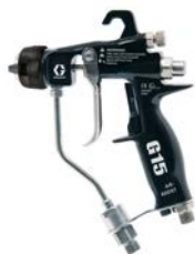
G15™ / G40™ Levegőrásegítéssel pisztoly