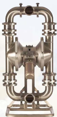
SaniForce 3150 HS