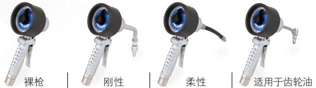
裸枪 刚性 柔性 适用于齿轮油