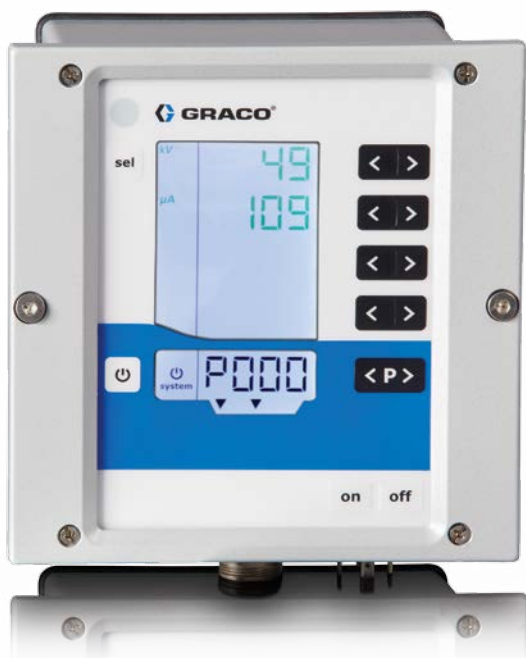
Unità di controllo

Con l'unità di controllo Pro Xpc Auto puoi ottimizzare i parametri di spruzzatura e ottenere una facile integrazione.