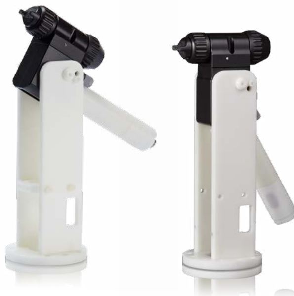
Pistola con manifold posteriore con montaggio su robot

I modelli di pistola presentano un cappello aria, codice 24N477, e un ugello da 1,5 mm, codice 24N616