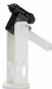
Braccio pieno Manifold posteriore