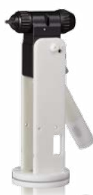
Braccio pieno Manifold inferiore