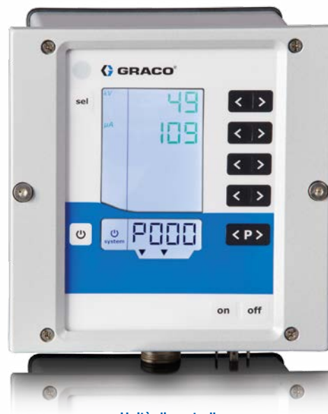
Unità di controllo