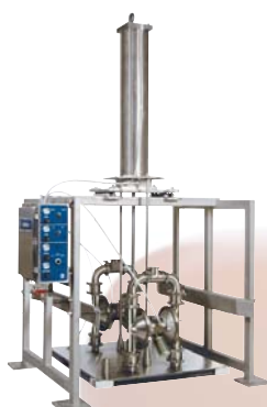
SaniForce 3150 BES