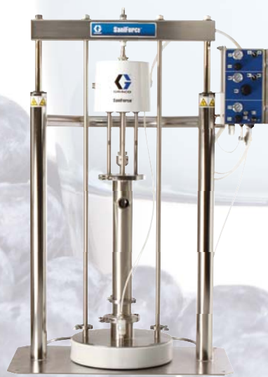
SaniForce 5:1 Scaricatore di fusti