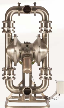
SaniForce 3150 3A

Tutti i dati, in forma scritta e illustrata, contenuti nel presente documento sono basati sulle informazioni disponibili sul prodotto al momento della pubblicazione. Graco si riserva il diritto di apportare modifiche in qualunque momento senza preavviso.