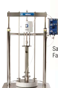
SaniForce 6:1 Fassentleerungsgerät