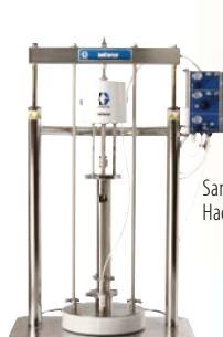
SaniForce 6:1 Насосная установка