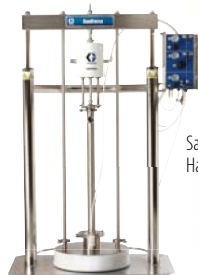
SaniForce 6:1 Насосная установка