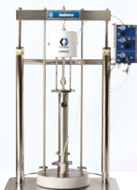
SaniForce 5:1 Насосная установка

Вся предоставленная в данном документе информация основана на последних данных, доступных на момент публикации. Компания Graco оставляет за собой право на внесение изменений без предварительного уведомления.