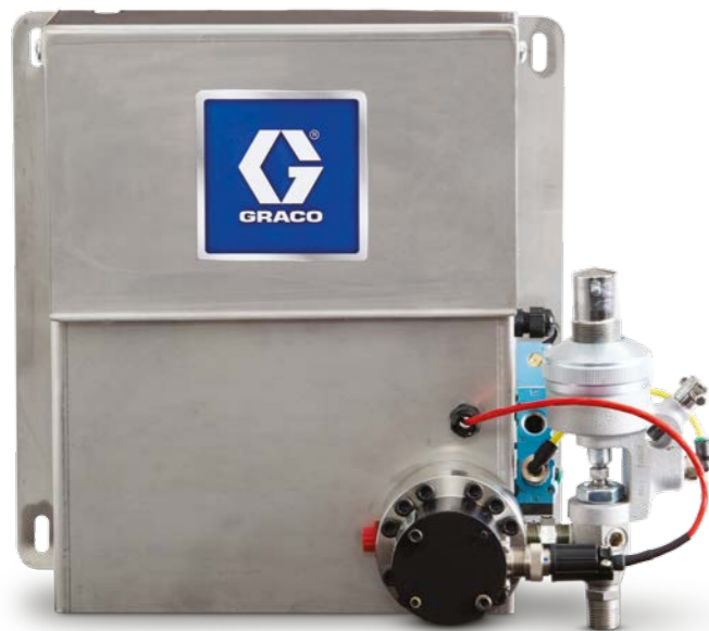
Panel de fluido de grasa G3000

Tanto si se desea procesar un único fluido como un máximo de ocho, ProDispense ofrece un control total de cada uno.