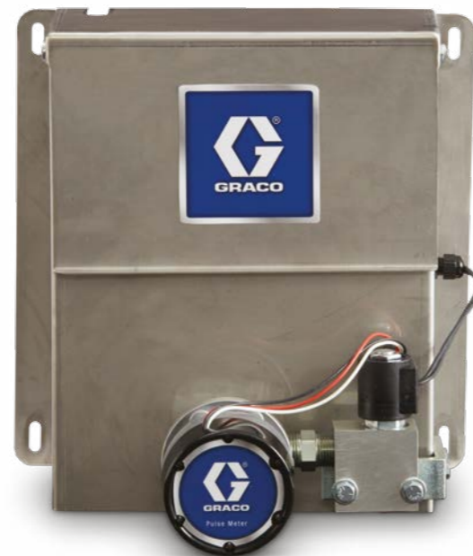
Panel de fluido de aceite o agua