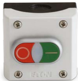
Arranque/parada a distancia