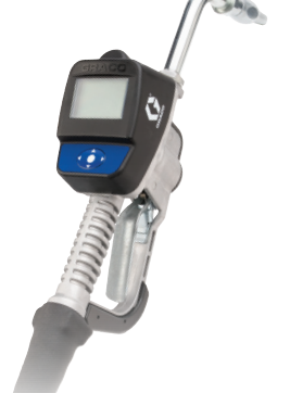
SDM 和 SDP 计量加注枪