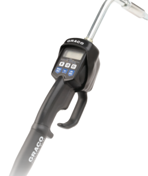
LDM 和 LDP 计量加注枪