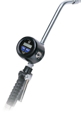
XDM6 和 XDM12 计量加注枪