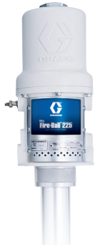
Mini Fire-Ball® 225