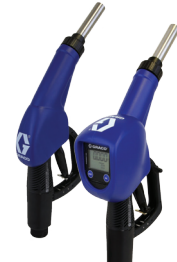
LD Blue 自动加注枪