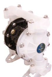
SD Blue 气动隔膜泵