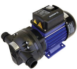
LD Blue 电动泵