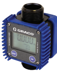
LD Blue 流量计