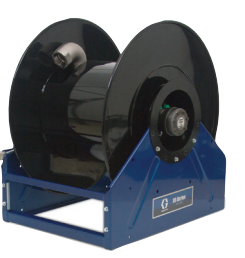
XD 系列 60/70/80 电动卷盘