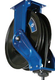
XD 系列 10/20/30