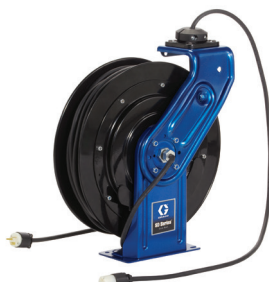
SD 系列电线和照明卷盘