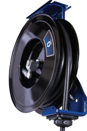
SD 系列 10/20