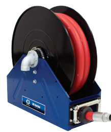
XD 系列 40/50