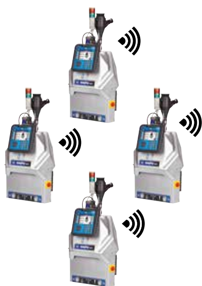
Оборудование, установленное в производственном цеху

Информация, полученная с помощью LineSite, экономит ваши деньги, позволяя быстрее диагностировать возникающих неисправностей, обеспечивает уверенность в подаче необходимого объема клея на одно изделие и, в целом, повышает эффективность работы Вашей упаковочной линии. Использование LineSite обеспечивает уверенность в точности выполнения поставленной задачи.