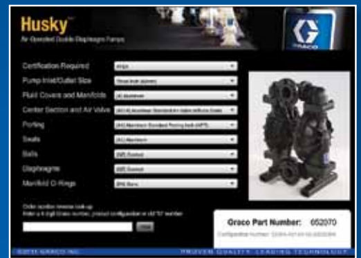
Ejemplo de la herramienta de selección de productos

Para ordenar una bomba Husky 3300, vaya a www.graco.com/husky para usar la herramienta de selección o ponerse en contacto con su distribuidor.