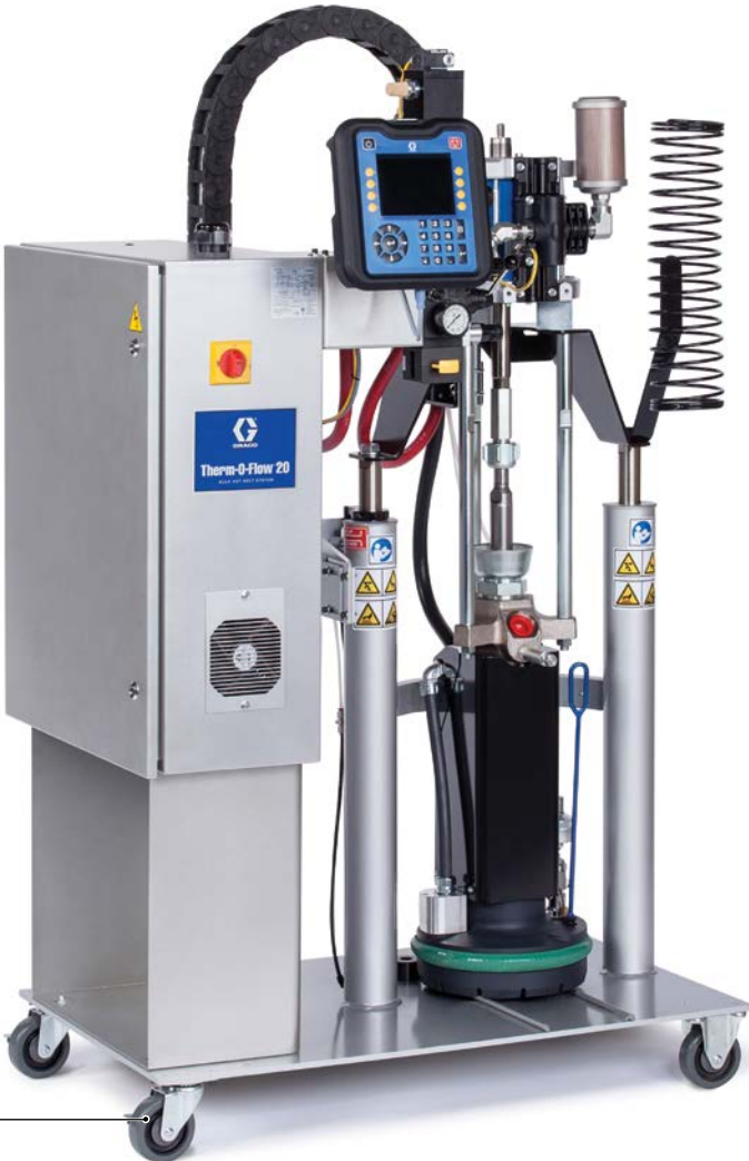
Therm-O-Flow 20 (5 gal)