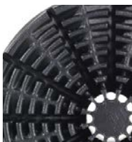
20 l (5 gal)