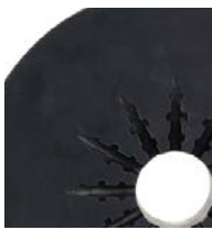
20 l (5 gal)