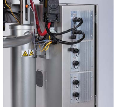
Müşteri tarafından tanımlanmış 12 ısı bölgesi için altı bağlantı noktası

Graco, uygulamanıza tam uyum sağlayacak şekilde yapılandırılabilen eksiksiz bir Therm-O-Flow büyük hacimli hotmelt sistemleri ve "kullanım noktasında" eritme sistemleri ürün ailesi sunmaktadır.