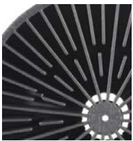
200 l (55 gal)