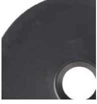
200 l (55 gal)