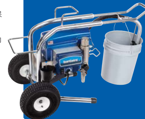
卧式移动型可轻松搭载标准的 19 升涂料桶。