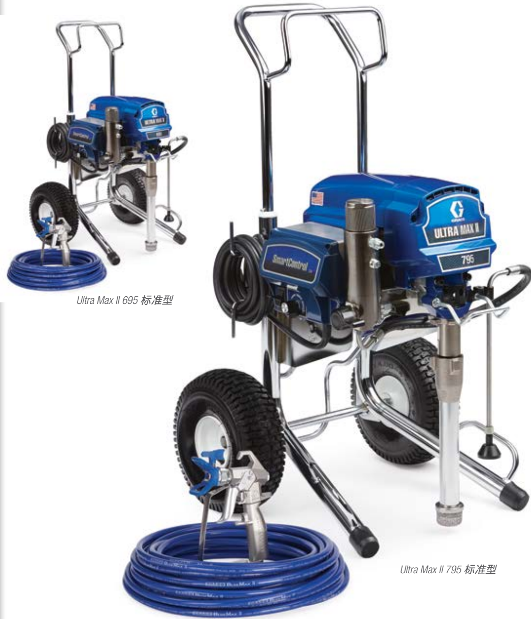
Ultra Max II 695 标准型