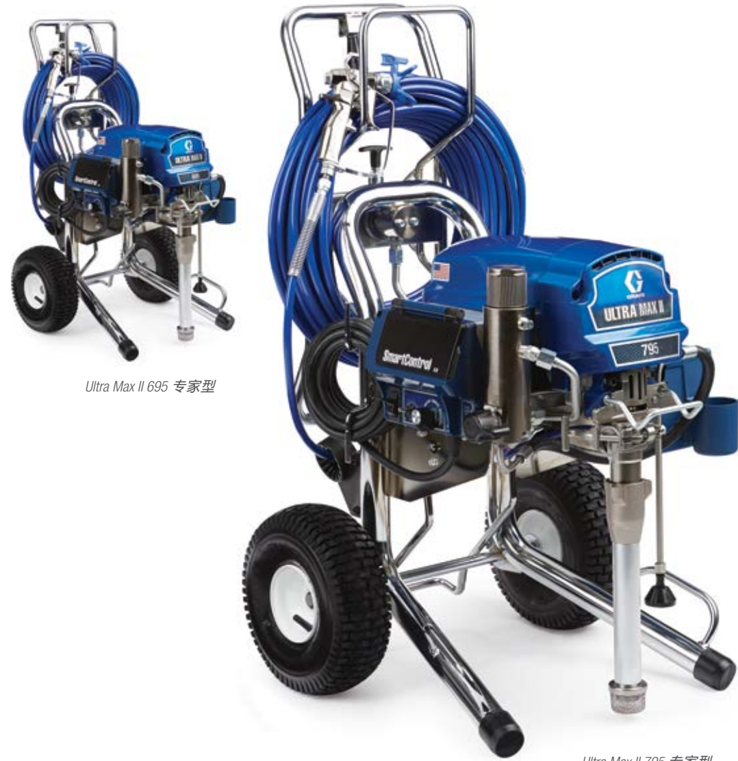
Ultra Max II 695 专家型