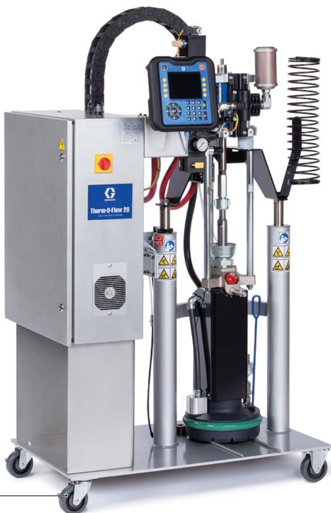
Therm-O-Flow 20 (20 litres)