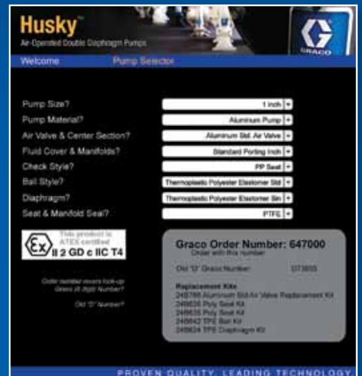
产品选型工具示例

如需订购 Husky 3300 泵，请访问 www.graco.com/husky3300 ，使用在线选型工具或联系您的经销商。