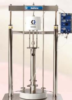
SaniForce 5:1 Насосная установка