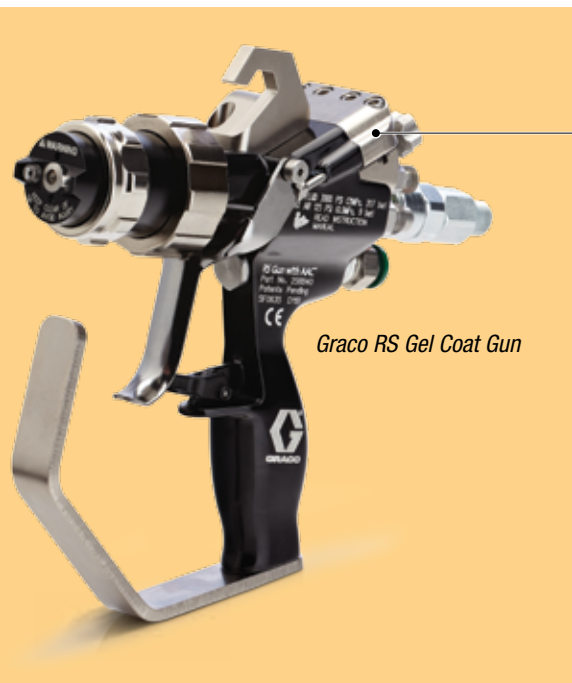
Graco RS Gel Coat Gun