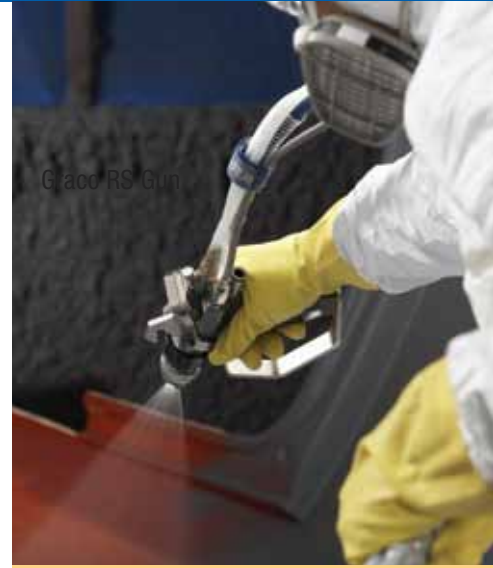
Graco RS Gun