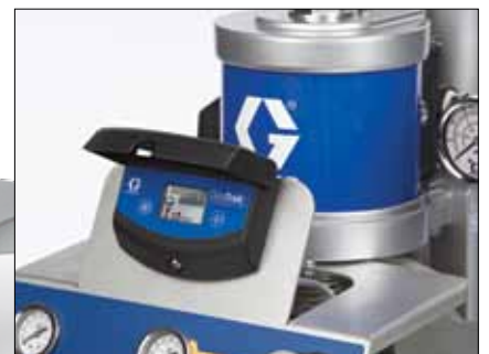
Graco Chop System