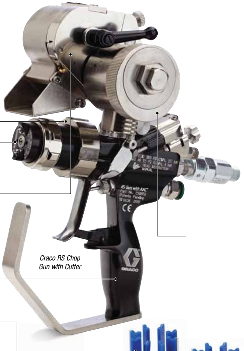
Graco RS Chop Gun with Cutter