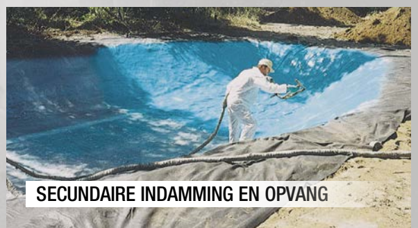
SECUNDAIRE INDAMMING EN OPVANG